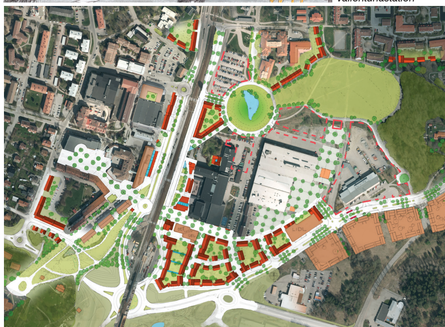
Vallentuna om 10 år